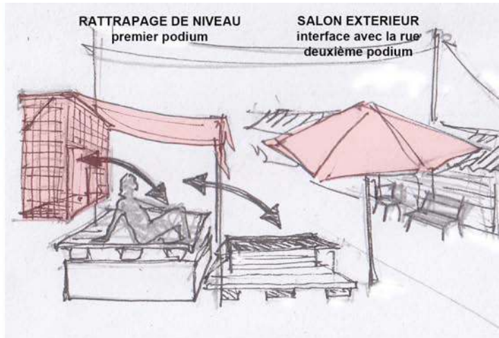
2007: appropriation extensive du domaine public : multiplication des niveaux jusqu'à la rue Klong Toey (Damronglatta Phiphat Road, emprise PAT)

2012: le même « sur-balcon » consolidé et agrandi Klong Toey (Damronglatta Phiphat Road, emprise PAT)