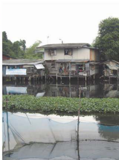
habitat spontané PUR

préexistant à la fondation de Bangkok comme capitale, transformé progressivement