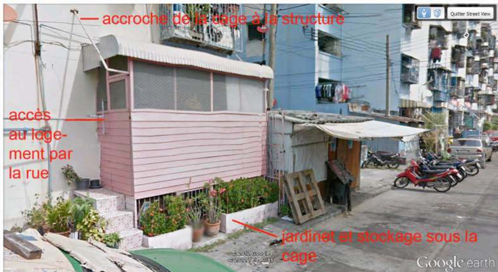
Figure 2 : Principe d'évolution d'une greffe spontanée sur un immeuble de logement social