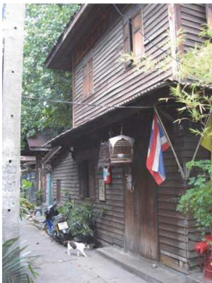
habitat spontané ANCIEN

Nous avons analysé l'habitat spontané dans sa dimension processuelle : il s'agissait d'identifier les contextes d'apparition de l'habitat spontané dans l'espace métropolitain, les facteurs qui en expliquent la consolidation et l'évolution, ainsi que le changement de son image au fil du temps. Cette méthodologie transversale peut être employée pour d'autres métropoles, et met en exergue à Bangkok trois grands contextes d'émergence – ou « configurations » – chacun proposant des enjeux et un intérêt propre pour la conception urbaine : l'habitat spontané « ancien », « pur » et « greffé » (voir figure 1).